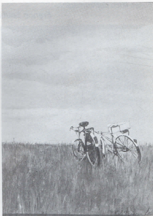
«Pic-nic», olio su cartone telato, cm. 25x35, 1986.