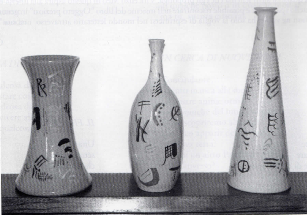
Ceramiche colorate a mano

È il tempo duro delle somme e delle distanze la pietà si curva su noi come madre oscura l'uomo ha sete beve lunghi dolori non può più misurarsi né alzare la vita né specchiarsi nel cielo né battersi il petto o chiamare il fratello a trovare parole che si dicevano è il tempo carico dei rimorsi delle lunghe strade senza rumore dei boschi che hanno alberi rigidi delle case d'aria grandi d'aria con le gocce che s'allungano fino all'alba e gli uomini fermi sopra le soglie di pietra davanti ai tempi così estesi di misura ed anni che il cielo accade appena e l'uomo va via e la parola si cheta nella chiusa meraviglia